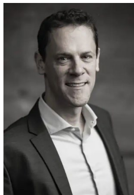
Chefredaktor: Philippe Chappuis